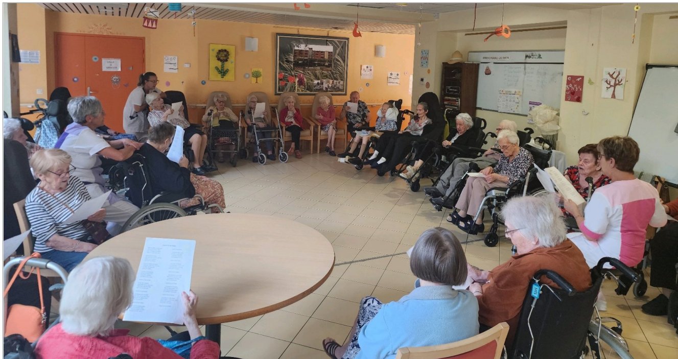
Fin d'après midi en chanson