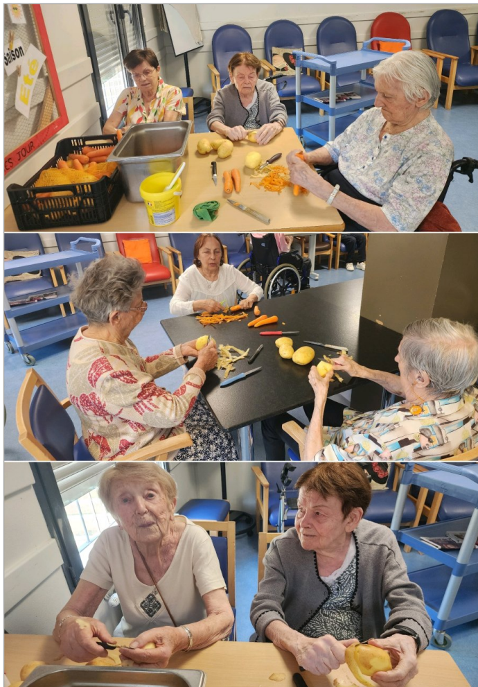
Épluchage des légumes au 1er étage