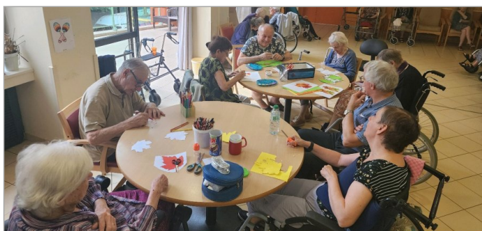
Aujourd'hui Atelier déco et groupe de musico