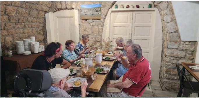
Restaurant et moment à la piscine