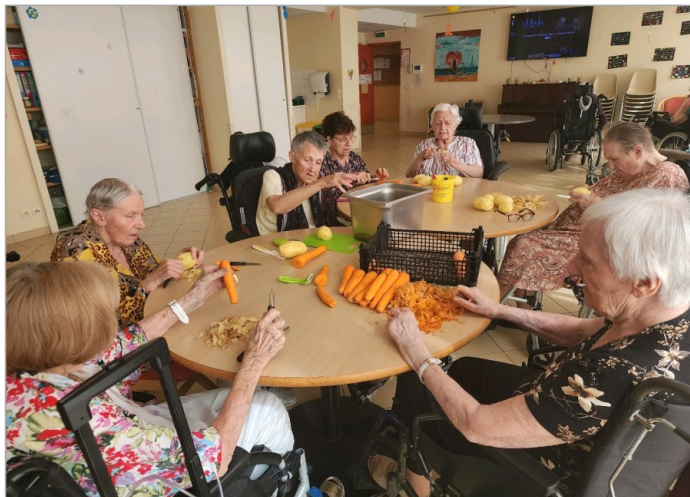
Préparation de la soupe