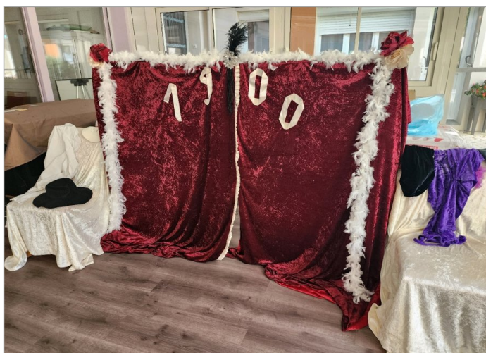
Invités par le Foyer Soleil, nous assistons à un spectacle 1900, apprécié par tous !