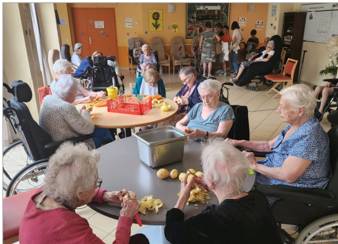
Préparation de la soupe!!!