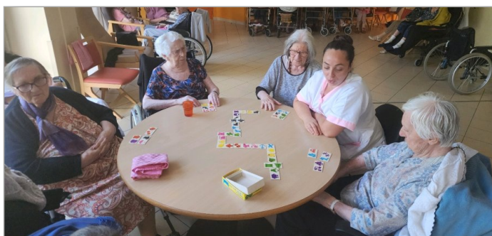
Jeux et épluchage cet après-midi