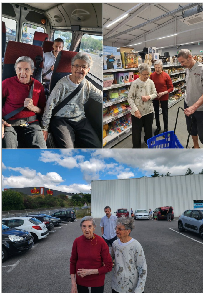
Quelques petits achats pour le loto et balade matinale.