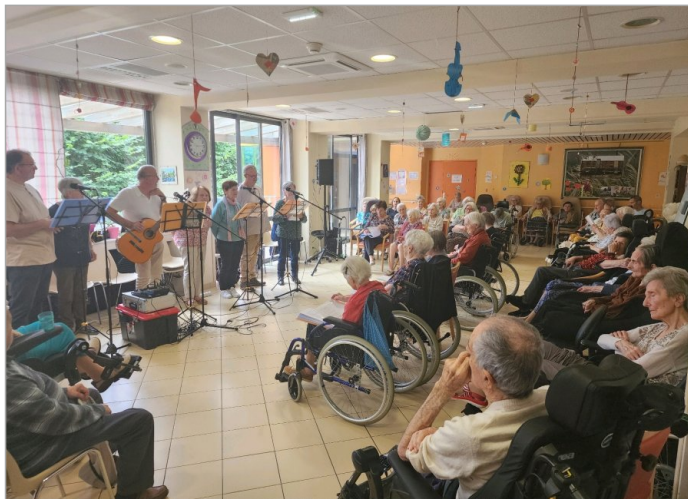
Après midi en musique