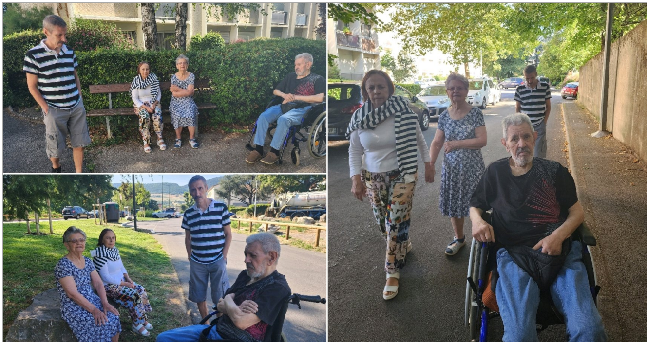
Promenade à la fraîche