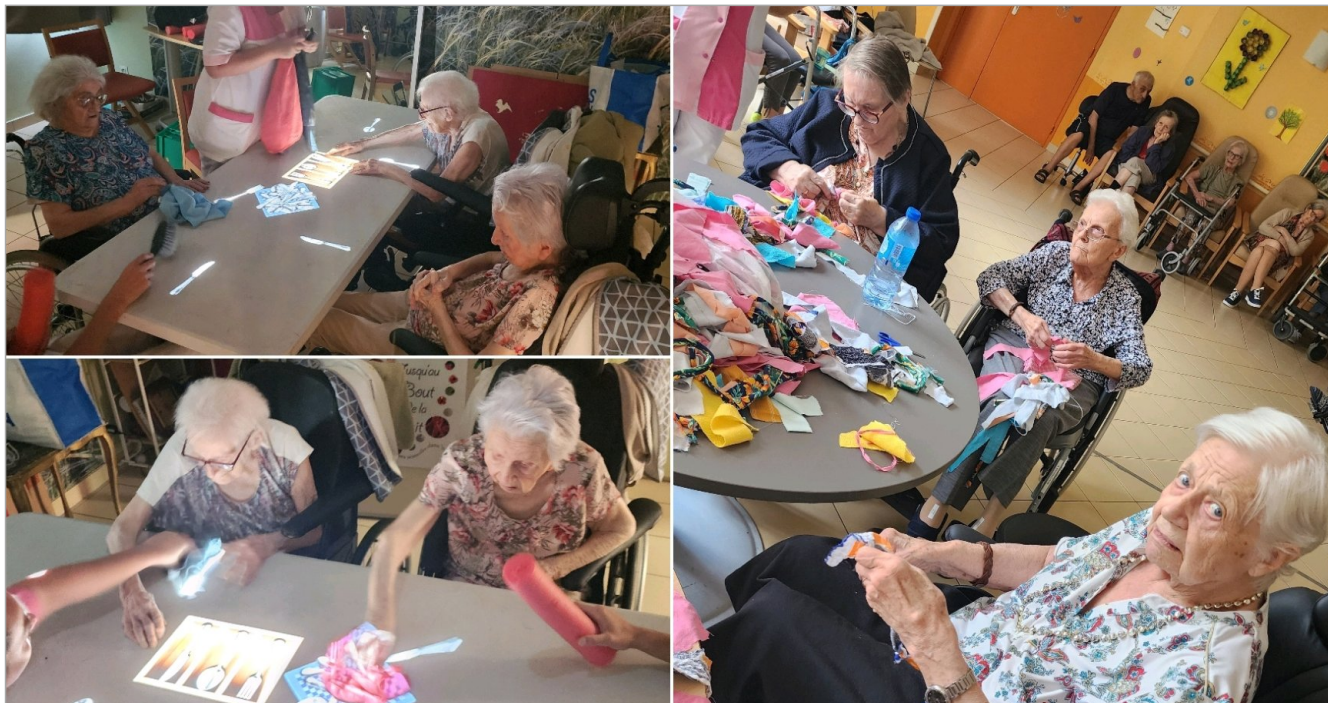
Après midi-table magique et continuité de nos guirlandes de tissus