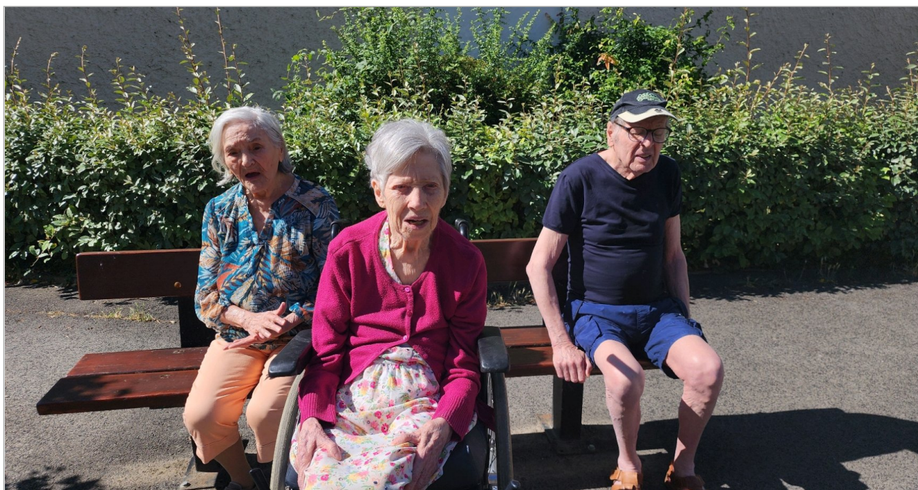
Balade autour de l'établissement