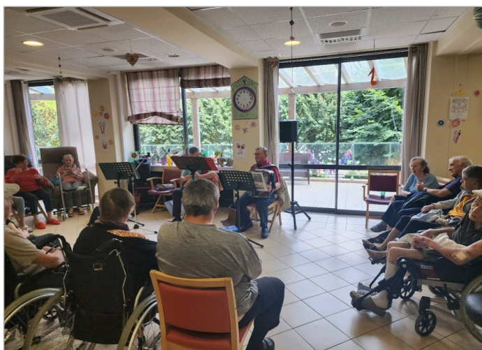
Après midi en musique