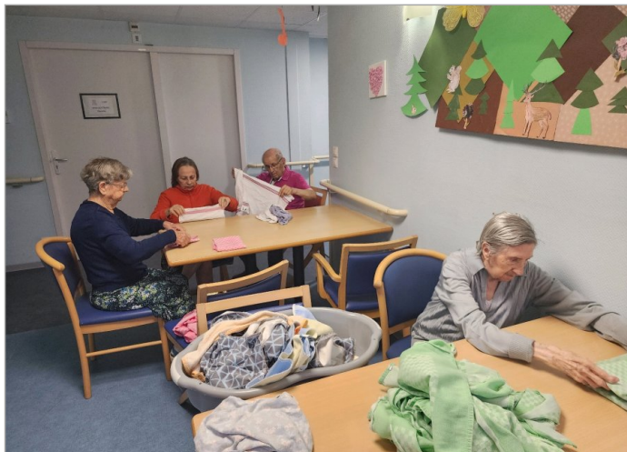
Pliage des serviettes pour certains et petite marche pour d'autres