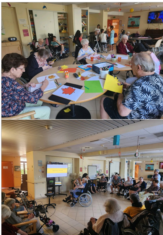
Début d'après-midi créatif et fin d'après-midi en chanson