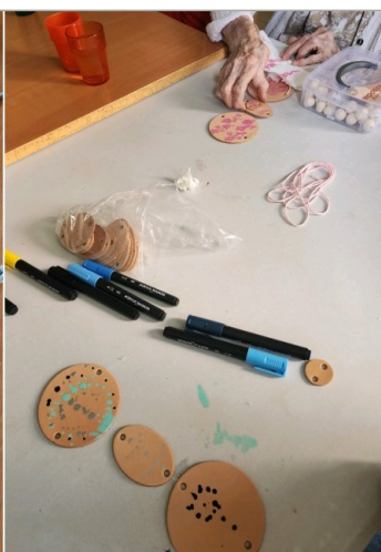
Atelier mensuel de maroquinerie