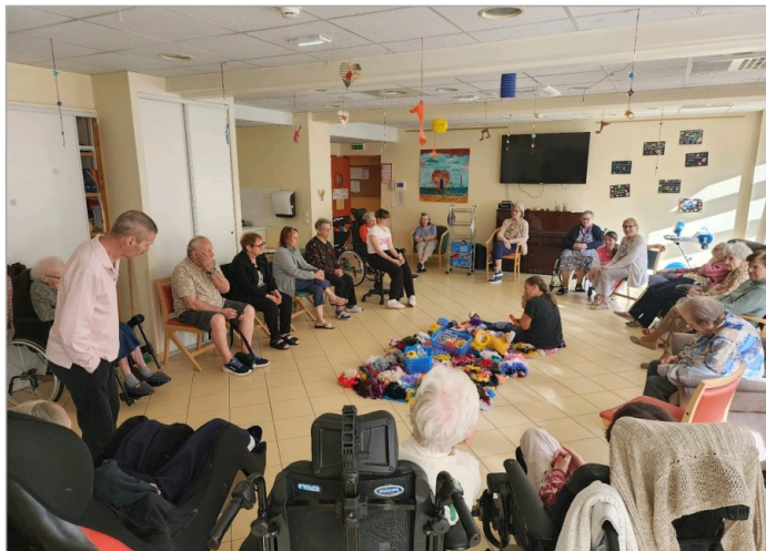
Visite des petits du lundi matin