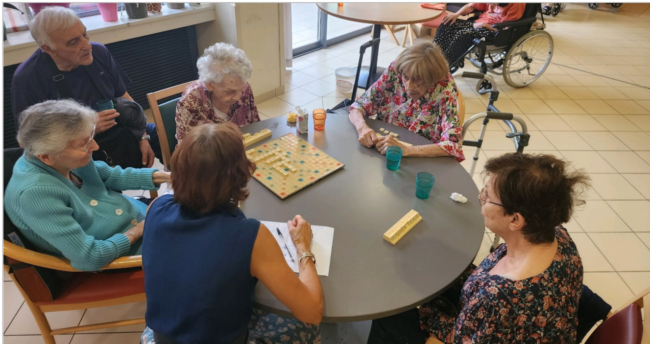
Petite partie de scrabble