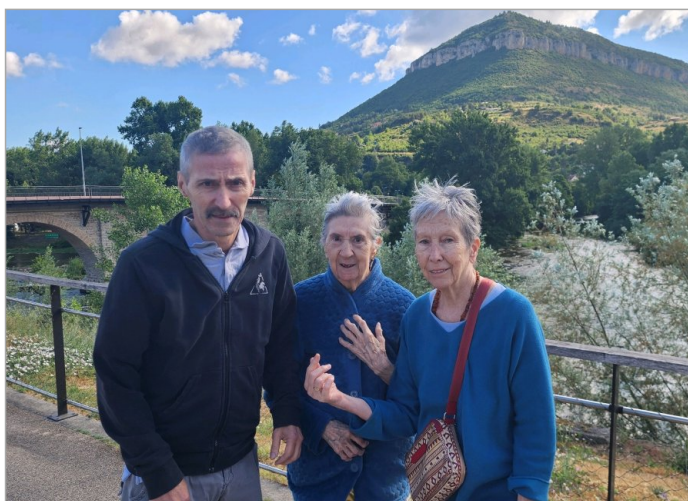
Nous profitons du rafraîchissement pour aller promener.