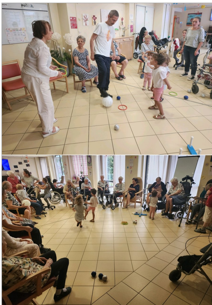
Matinée avec les petits : jeux, rigolades et câlins...