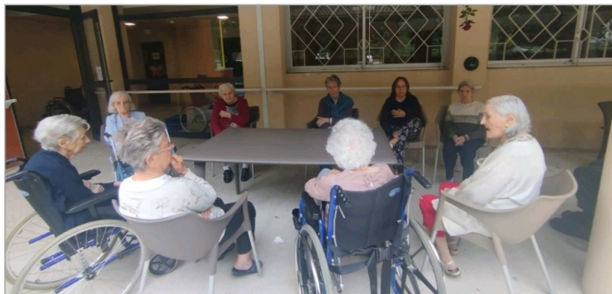
Goûter en extérieur pour le secteur protégé ce week-end