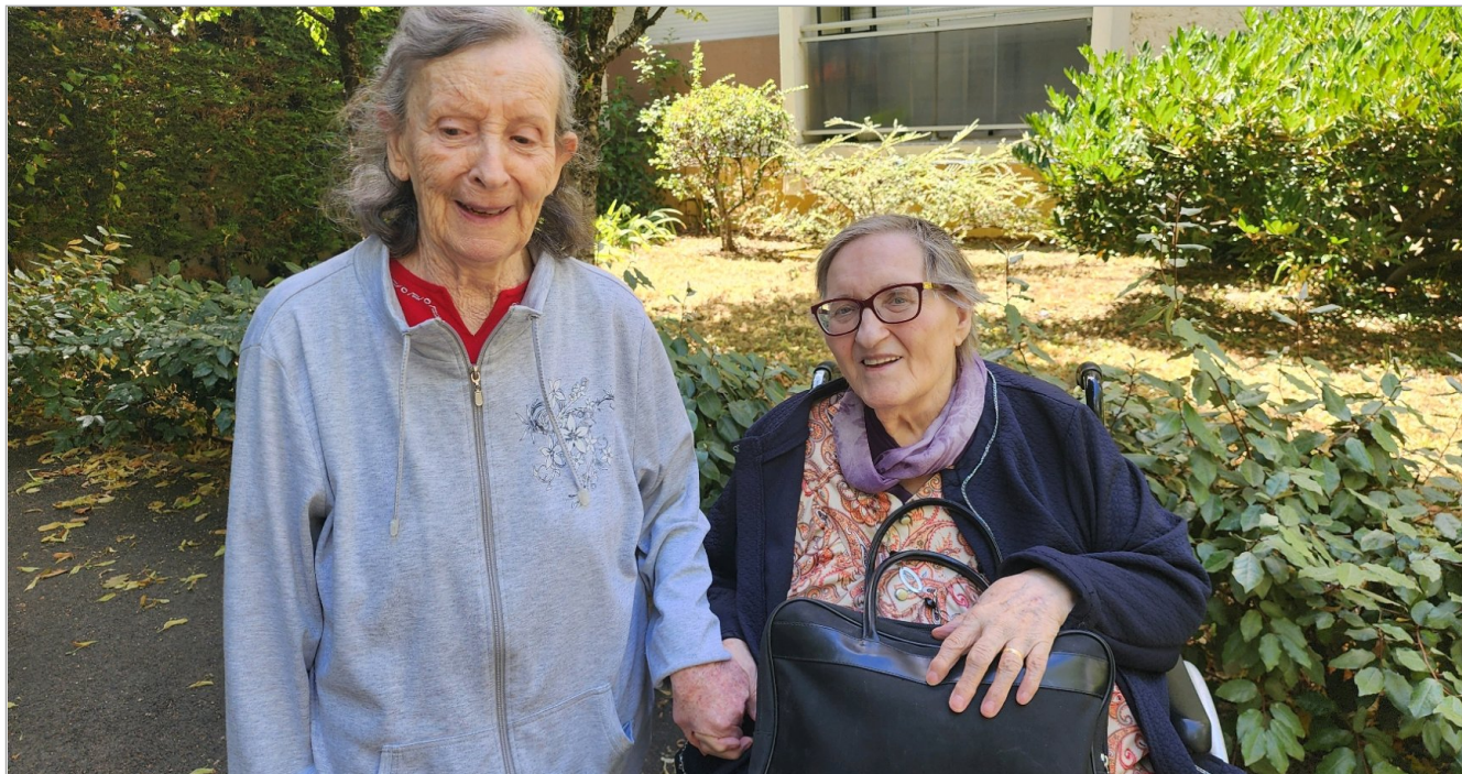
Balade à la fraîche