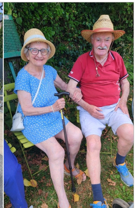
Petit moment au bord de l'eau