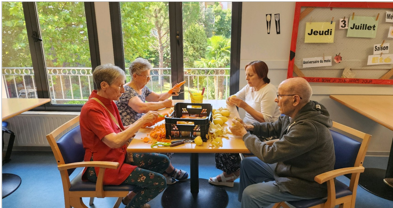
Vendredi épluchage des légumes à l'unité protégée.