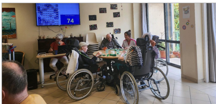
Après midi loto