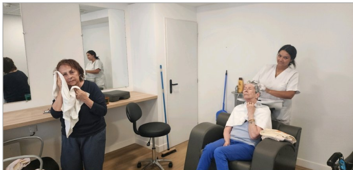
Petit moment de détente avant notre après midi loto