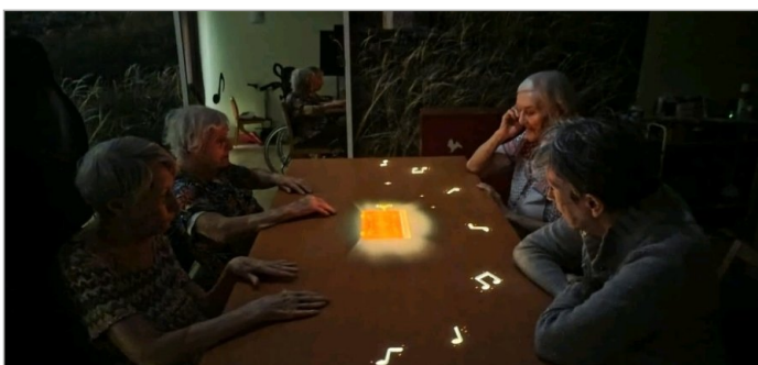
Petit moment sur la table magique