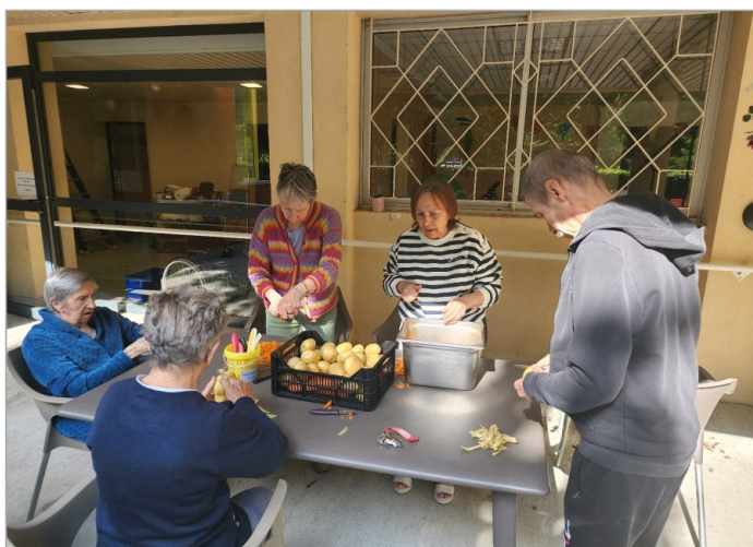
Épluchage en plein air à la fraîche