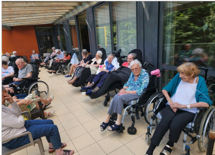
Petit moment en terrasse musique et boisson ...